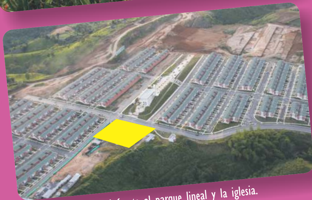
Quedará frente al parque lineal y la iglesia.